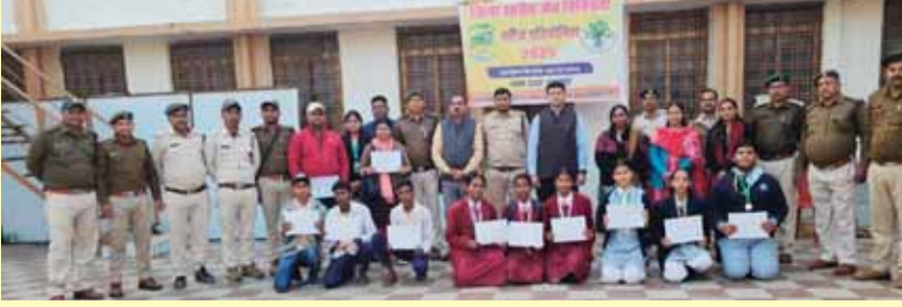
हरिभूमि न्यूज अनूपपुर।