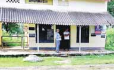
हरिभूमि न्यूज अनूपपुर।

मौहरी और हरद के बीच धुरवासिन रेलवे स्टेशन में गंदगी से यात्री परेशान हैं। एक तरफ देश के प्रधान मंत्री नरेंद्र मोदी कह रहे हैं की स्वच्छ भारत स्वच्छ प्रदेश मगर रेलवे स्टेशन के चारो तरफ गंदगी पसरी है। स्टेशन प्रबंधन स्वच्छता अभियान को पलीता लगाते नजर आ रहे हैं। धुरवासिन स्टेशन का हाल यह है की चारों तरफ बड़ी बड़ी गाजर घास उगे हैं। कचरे का ढेर लगा हुआ है, जिससे यात्रियों को सांप बिच्छू काटने का भय बना रहता है। ज्ञात हो कि कोतमा बिजुरी चिरमिरी क्षेत्र से कोयला से शासन को करोड़ों का राजस्व मिल रहा है, लेकिन रेलवे प्रबंधन के द्वारा इस क्षेत्र के साथ सौतेला व्यवहार किया जा रहा है। ग्रामीण क्षेत्र का रेलवे स्टेशन होने के कारण यहां दर्जनों गांवों जिनमें ग्राम कोटमी, तितरीपोड़ी, रक्सा, कोलमी, पडौर, देखल, खारौली, क्यांटा, धुरवासिन, फुन्गा, बिजौरी, छोहरी के नजदीक रेलवे स्टेशन धुरवासिन से यात्री कोतमा, अनूपपुर, शहडोल सहित अन्य जगहों के लिए यात्रा करते हैं लेकिन स्टेशन में सुविधा के नाम पर कुछ भी नहीं है। इस संबंध में ग्रामीणों ने कई बार स्टेशन